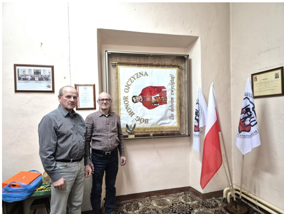
Nasza „okazała” siedziba