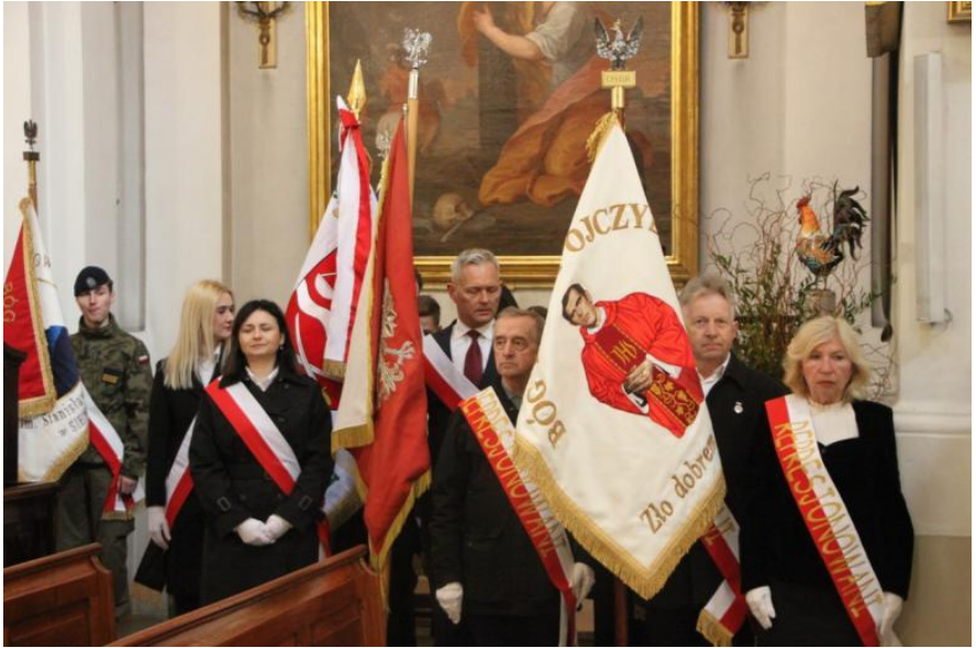
Poczet sztandarowy Stowarzyszenia