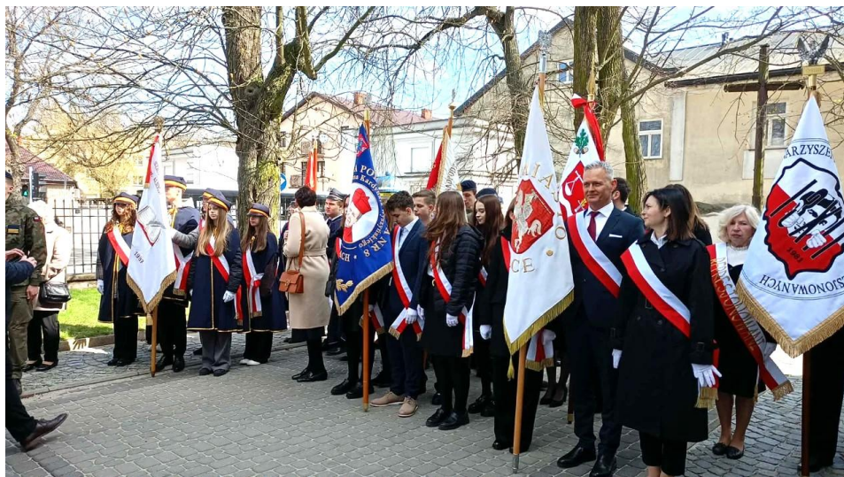
Hołd złożono przy Pomniku Sybiraków znajdującym się także na terenie przykościelnym.